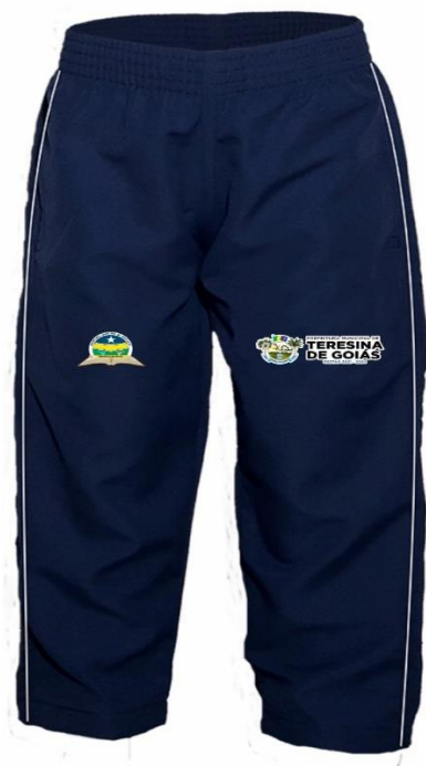
FIGURA 3 – SHORT SAIA